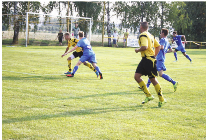
Tečovice A – Viktoria Otrokovice B 1:1 , PK 3:4