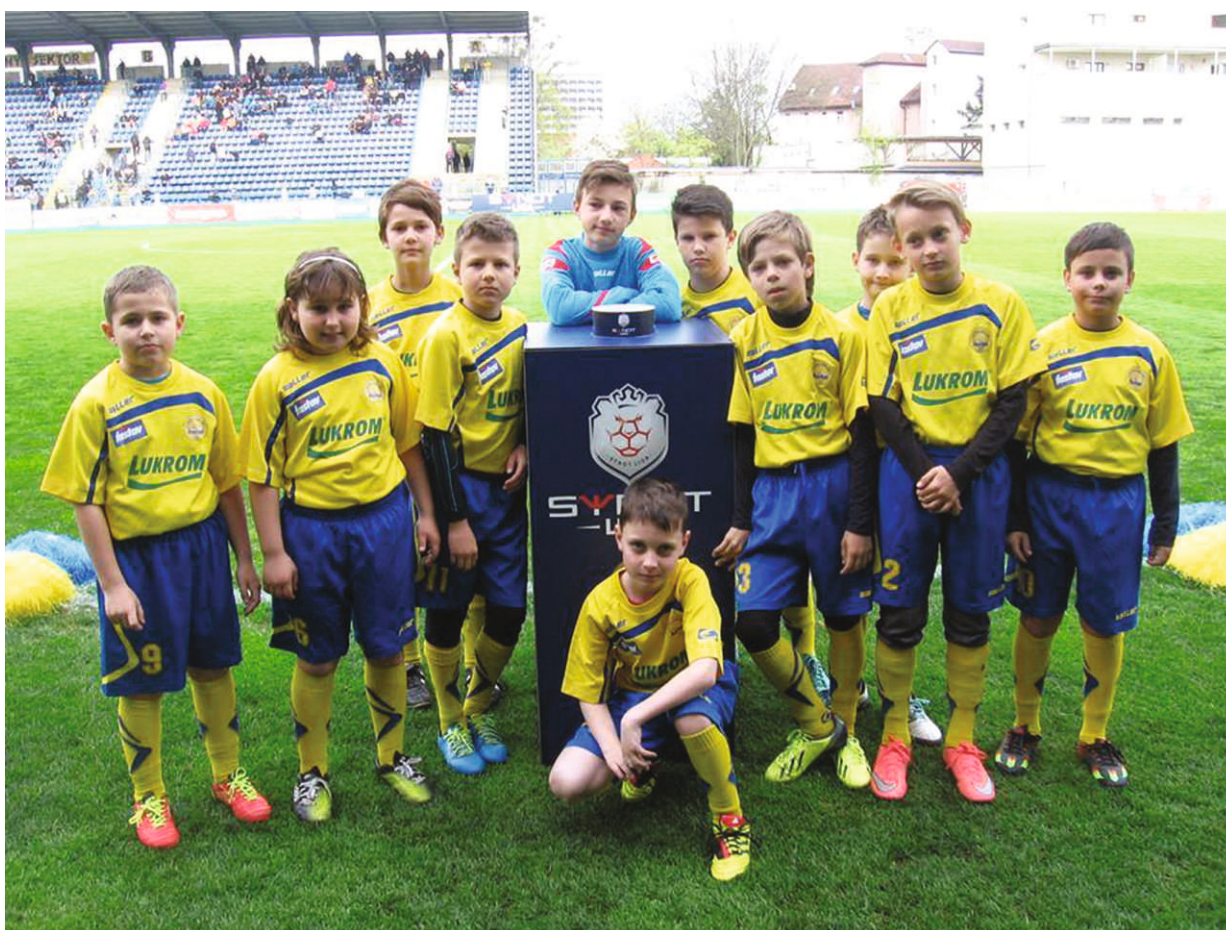
Nejmladší reprezentace Bivoje na zápase synot ligy Fastav Zlín – Dukla Praha – jaro 2016

Na závěr nezbývá než popřát Sokolu co nejvíce štěstí nejen na poli sportovním ale i hospodářském. Bude to letošní sezónu určitě potřebovat.