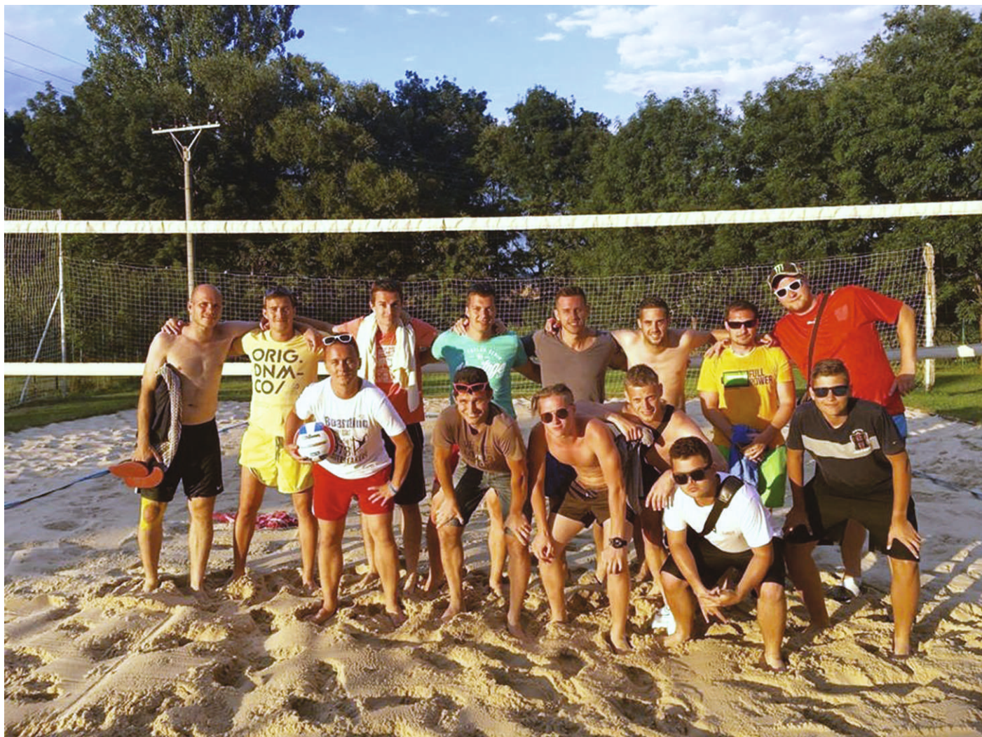
Soustředění B týmu mužů , Štítná nad Vláří – (zdroj Facebook)