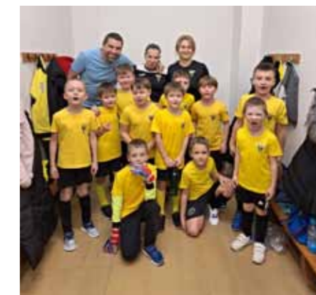
Reprezentace mladší přípravy po zápase v Tlumačově.