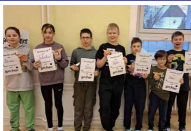
Pátáci letos prožili svou Noc s Andersenem v kouzelném světě Bradavic. Celým večerem je provázel Harry Potter. Děti pomáhaly rozluštit šifry hlavních postav, vyzkoušely si famfrpál, ve kterém nechyběl ani zrádný potlouk, kterého s velkým nadšením ztvárnil Oliverek. Velký úspěch měly také „Bertíkovy lentilky tisíckrát jinak“ i zlatonky.