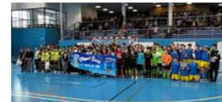
Nástup týmů při vyhodnocení výsledků v kategorii mladších žáků na halovém turnaji v Otrokovících 11. 1. 2026.

V neděli 11. 1. 2026 odehráli naši mladší žáci halový turnaj v Městské sportovní hale v Otrokovících. Po 3. místě v základní skupině a vítězství 1:0 nad Brumovem v zápase o celkové pořadí jsme skončili v konkurenci deseti týmů na krásném 5. místě.