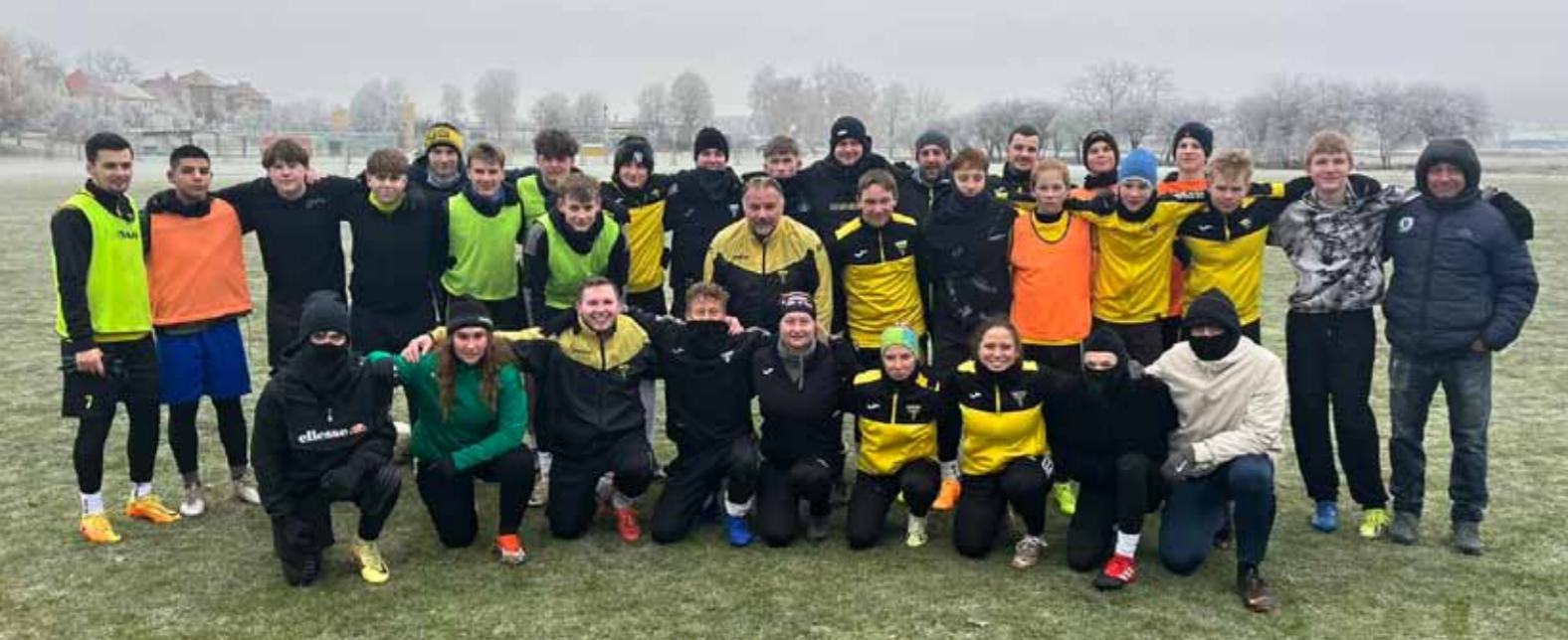
Silvestrovský fotbalík na Bivoji. Poslední den v roce 2025 si skupina genderově i věkově nerozlišených účastníků přijala setkáním na hrací ploše a společně stráveným fotbalíkem a naladila se tak aktivně na oslavu Silvestra 2025.