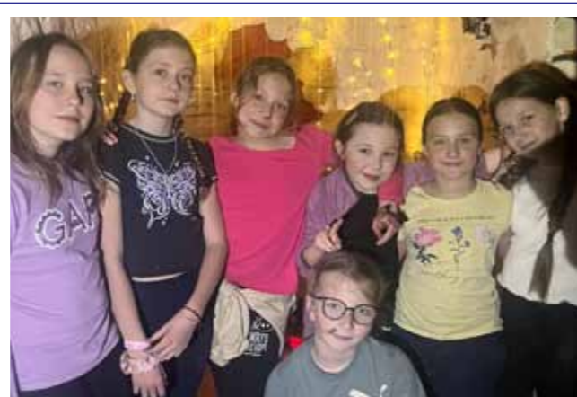
Třetáci prožili jednu z nejkrásnějších nocí v roce. Ocitli se ve světě, kde nic není takové, jak se na první pohled zdá... Ponořili se do příběhů Roalda Dahla, které je provedly kouzelným světem fantazie. A když nastal čas ke spánku, obr Dobr dohlédl na klidnou noc a seslal všem příjemné sny, ve kterých se jistě ještě pokračovalo v dobrodružstvích.