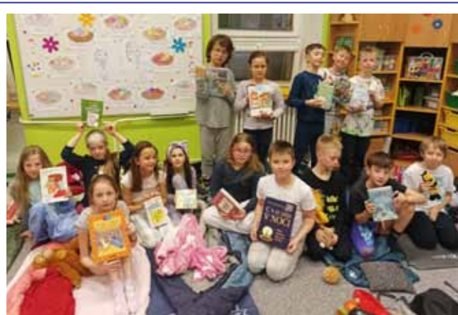
Letošní Noc s Andersenem se u čtvrtáků nesla v duchu pravěku. Děti se vydaly po stopách archeologů, objevovaly dávné světy a seznamovaly se s životem našich předků. Čtvrtáci si vyzkoušeli aktivity spojené s archeologií, jeskynnými malbami, pracovali s příběhy, tvořili a společně prožili večer plný dobrodružství, fantazie a objevování.