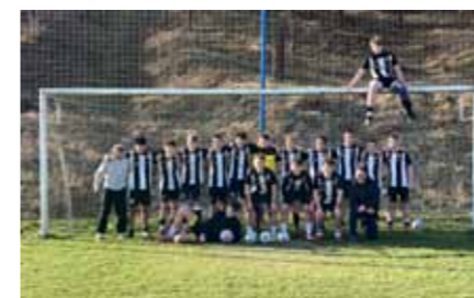
Skupina dorostenecké reprezentace Bivoje na soustředění v Brumově-Bylnici.