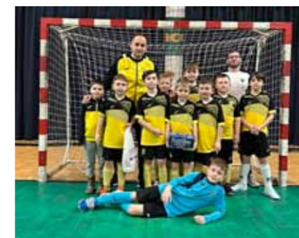
Reprezentace v kategorii starší přípravy na halovém turnaji ve Zlíně.

V sobotu 17. 1. 2026 jsme odehráli se starší přípravkou halový turnaj ve Zlíně. Navzdory četným absencím, hlavně starších hráčů, jsme nakonec vybojovali krásné 7. místo z 10 týmů. Zejména na otočení zápasu ve skupině proti SK Zlín A z 0:1 na 2:1 a pak na výhru 2:1 nad SK Zlín B v zápase o celkové umístění jsme náležitě hrdí.