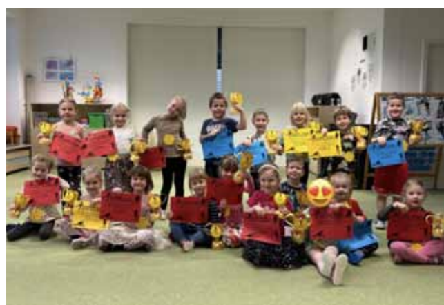
Děti z Berušek si užily malou školkovou olympiádu. Každý den soutěžily v jednom sportu, za který pak získávaly body. Nechyběl curling, biatlon ani hokej. Nakonec se uskutečnilo jejich sečtení a slavnostní vyhlášení vítězů. Byl to skvělý týden plný nových zážitků, sportovních výkonů, vzájemné spolupráce a podpory.