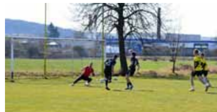
Příprava Tečovice A – Luhačovice A, hosté (černá 15) otevírají skóre 0:1.