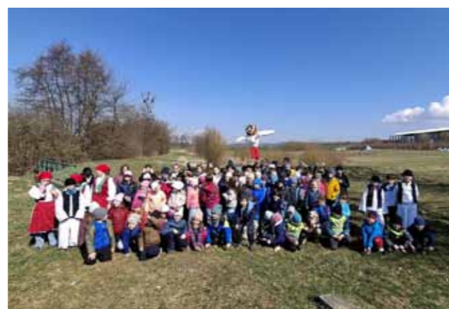
V pondělí 24. března si děti připomněly starou lidovou tradici vynášení Moreny. Pátáci vytvořili Morenu, děti z parlamentu přišly v krojích a společně s mateřskou školkou prošly jarním průvodem. Paní Zimu tak podle dávných zvyků děti odevzdaly a jaro mohlo být slavnostně přivítáno.