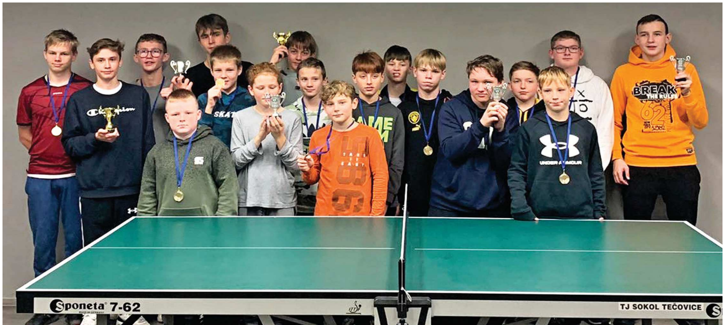
Účastníci ping-pong žákovského vánočního turnaje 2022.

tivních „Old-boys“ členů TJ. Všechna utkání mají obvykle správný sportovní náboj a turnaje dopadnou dobře i po společenské stránce.