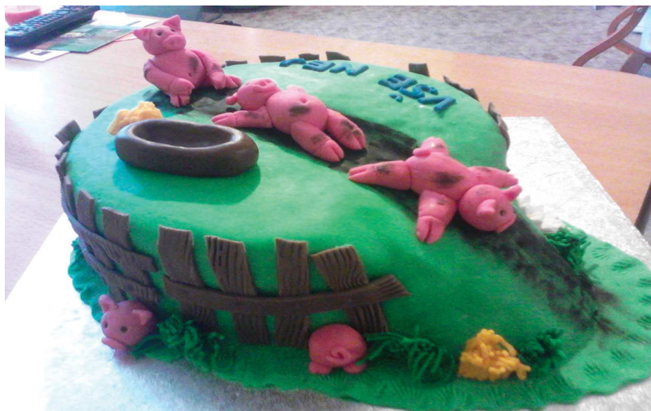
Jitka ráda peče.