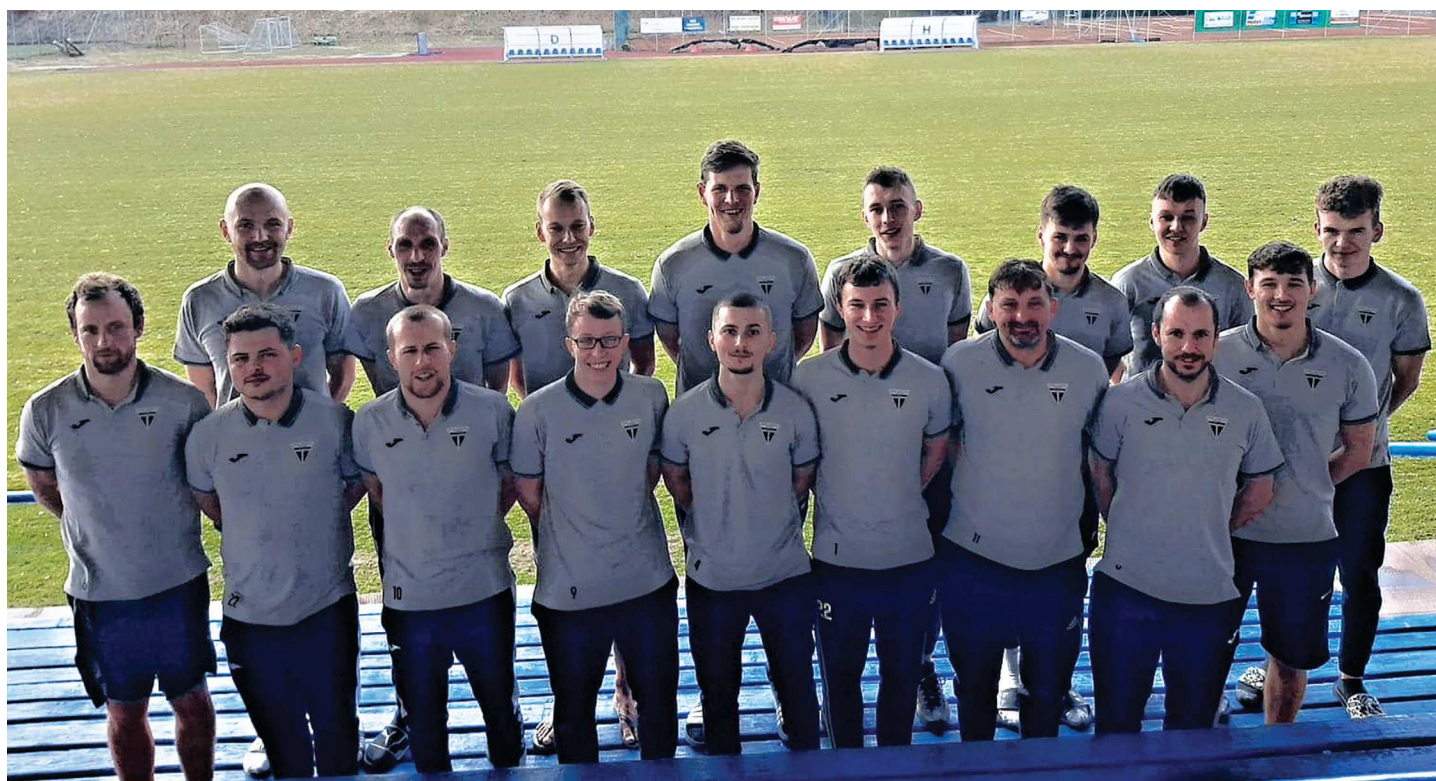
Účastníci soustředění týmu mužů v Morkovicích, kde budou hráči nabírat fyziku až do morku kostí a také ladit formu do jarních bojů 1.B třídy.

O soupisce pro období JARO 2023 se rozhodne až po uzávěrce tohoto příspěvku.