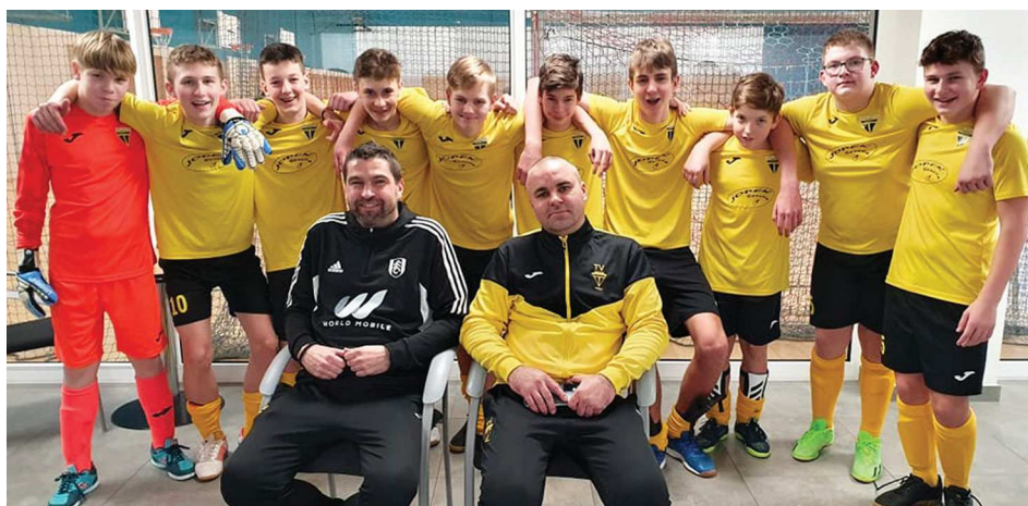
Starší žáci na turnaji OFS ve sportovní hale v Otrokovcích „Na Štěrkáčích“.

Zimní příprava probíhá v tělocvičně ZŠ Malenovice + UT Sazovice, po úpravě sprch v kabinách (viz parkohospodářská činnost) a při změně počasí k teplejším dnům se však příprava vrátí do venkovního terénu v areálu „V Králi“. V rámci přípravného období tým absolvoval halový turnaj v únoru ve sportovní hale „Na Štěrkáčích“ za účasti týmů Bařova, Halenkovic, Vizovic, Horní Lhoty a Tečovic ve skupině „A“ a Louk, Štípy, Březové, Luhačovic a Mladcové ve skupině „B“. I když dokázali ve skupině odehrát zápasy tak, že jejich skóre bylo vyrovnané, stačilo to pouze na zápas o 7. až 8. místo. Po nerozhodném výsledku 1:1 však podlehlí Luhačovicím v penaltovém rozstřelu.