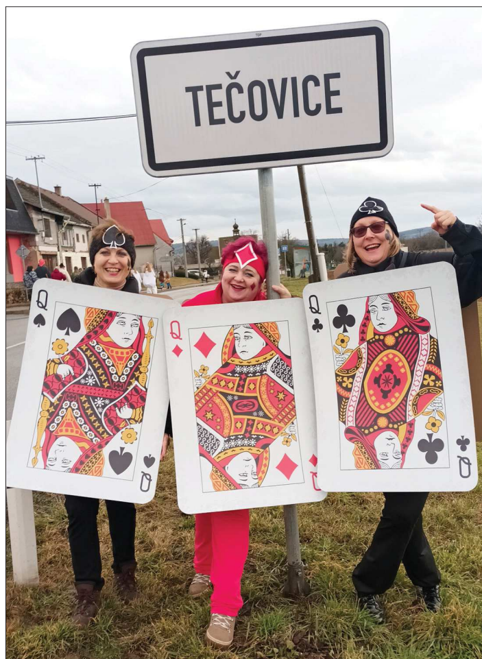
Z-dravé ženy slaví masopust.