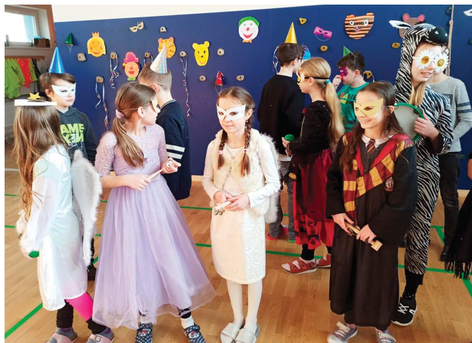
Maškarní karneval ve škole.