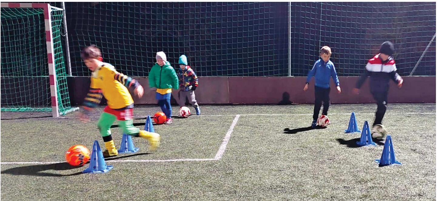
Momentka z přípravy našich nejmladších reprezentantů na „umělce“ v Sazovicích.

Zájemci o účast ve vedení těchto mládežnických týmů, kontaktujte příslušné stávající trenéry mládeže nebo přímo vedení VV TJ. (vv)