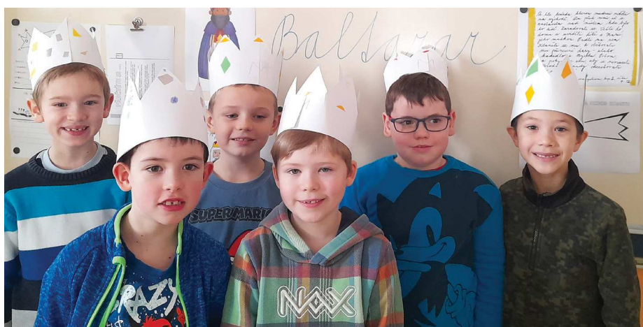
My tři králové jdeme k vám.