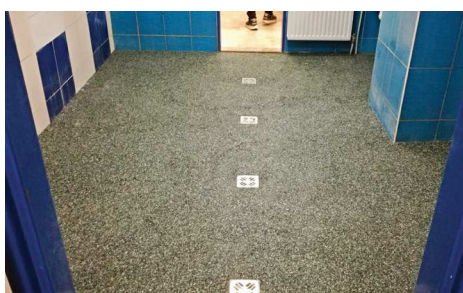
Opravená podlaha ve sprchách ve 2. NP.

Poděkování za úklid kabin po stavební rekonstrukci sprch patří družstvu žen, které pod organizačním velením Hanky Hrbáčkové provedlo úklid vnitřních prostor kabin a zútulovalo tak zázemí pro sebe sama i soupeře využívající tyto místnosti.