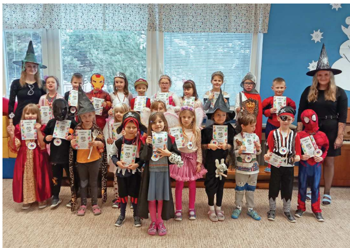
Vystoupení třetí třídy MŠ.