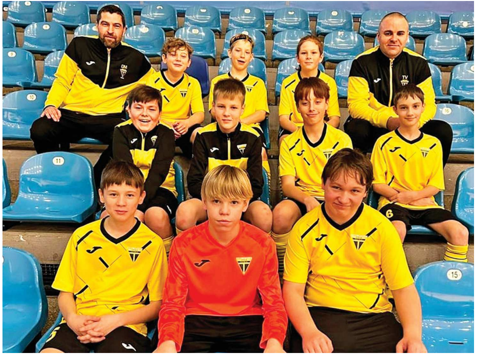
Mladší žáci na halovém turnaji OFS ve sportovní hale ve Zlíně.

Zimní příprava probíhá v tělocvičně ZŠ Mysločovice + UT Sazovice, po úpravě sprch v kabinách (viz parkohospodářská činnost) a při změně počasí k teplejším dnům se příprava vrátí do venkovního terénu v areálu „V Králi“. Družstvo mladších žáků během zimní přípravy odehrálo dva halové turnaje: 1x v Bystřici pod Hostýnem za účasti soupeřů z Prusinovic, Bezměrova, Bystřice pod Hostýnem a Kelče a 1x ve sportovní hale ve Zlíně, kde hrálo ve skupině „A“ (Louky, Jaroslavice, Napajedla, Lípa, Tečovice). Ve skupině „B“ se turnaje účastnily týmy Bařova, Mladcové, Malenovic, Březové a družstvo dívek Zlína. Po zisku 3. místa ve skupině odehráli naši reprezentanti zápas o 5.–6. místo, v němž podlehli Bařovu největším rozdílem 1:2. V únoru absolvoval tým přípravný zápas na umělé trávě u stadionu M. Valenty v Uherském Hradišti s dívkami 1. FC Slovácko. Během jarní části sezony si budou chtít udržet kladnou bilanci z podzimu (5 výher, 1 remíza, 4 prohry) a vylepšit postavení v tabulce krajské soutěže, kde jim po podzimu patří zatím 5. pozice. Daniel Mahdal