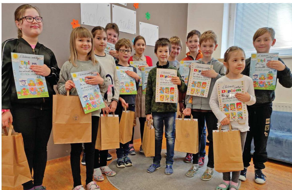
Účastníci recitační soutěže.