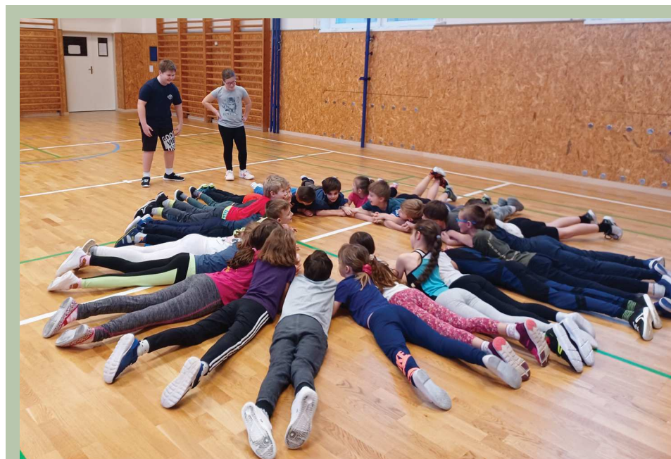
Zábavná tělesná výchova.