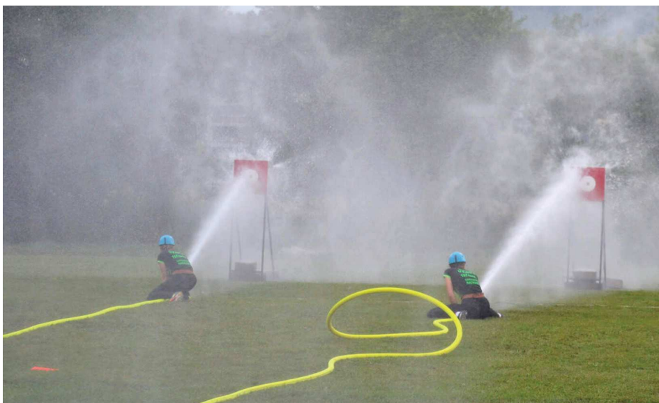
Požární útok tečovických žen v roce 2022.