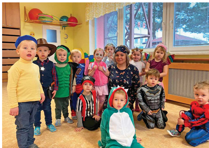
V první třídě mateřské školy.