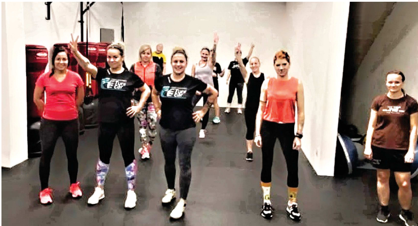
Momentka z přípravy týmu žen, Sportcentrum Malenovice.