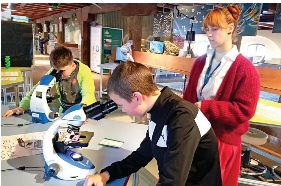
Na návštěvě v Pevnosti poznání v Olomouci.

Vzdělávací program byl završen prohlídkou historického jádra Olomouce s pamětihodnostmi na Horním náměstí a návštěvou vánočních trhů, které v nás probudily atmosféru klidu a pohody. Co stánek, to jiné originální zboží, spousta dobrot, vánoční dárky. Vedle vánočního stromu jsme si zazvonili na Zvoníčku, která dle legendy plní tajná přání. (mm)