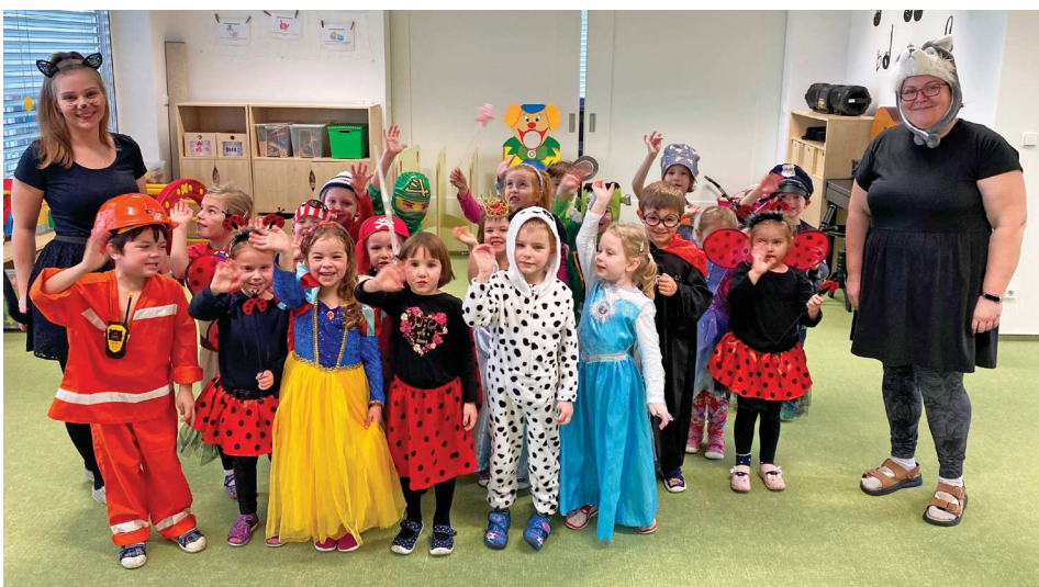
Druhá třída mateřské školy.

Samotný karneval si pak děti užívaly převlečeny za své oblíbené pohádkové postavy nebo akční hrdiny. Hrály karnevalové hry, soutěžily, plnily jednoduché úkoly, nechybě-