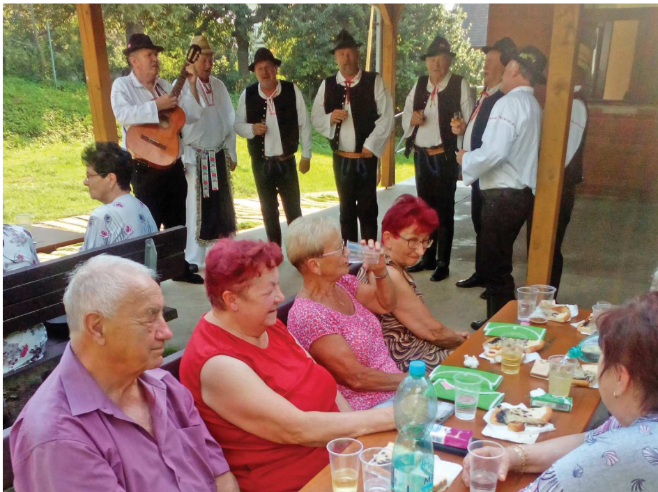
Přátelské posezení s důchodci.