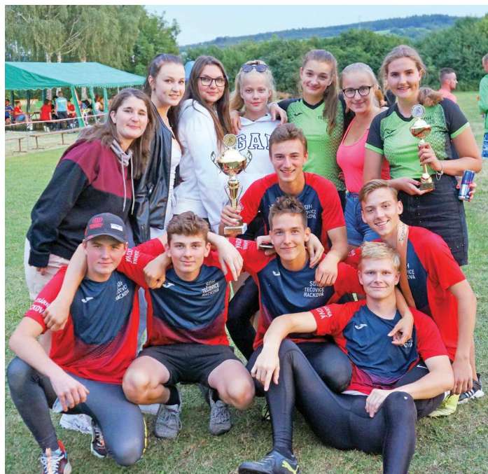
Na soutěži Hasičský maraton.

Příchod topné sezony a nastávající chladné období nám přináší také