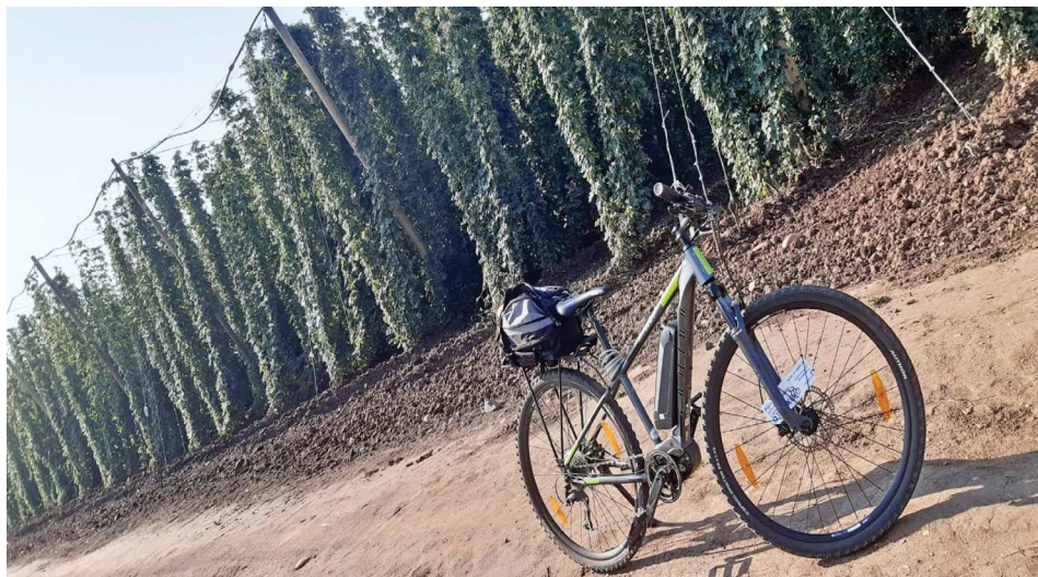
Na kole mezi chmelnicemi.

cena předplatného 10ti lekcí 450,-Kč cena jednotlivých lekcí 50,-Kč