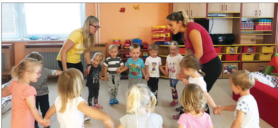
V mateřské škole na začátku nového školního roku.

Kromě toho nás v letošním školním roce čeká ještě spousta dalších akcí a aktivit, na které se už teď těšíme... (aj)