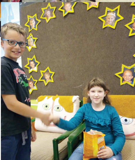
(ih) Narozeninová party ve 2. třídě.

My máme narozeniny. Dnes máme přání jediný, šťěstí, zdraví, štěstí, zdraví... Hlavně to zdraví!