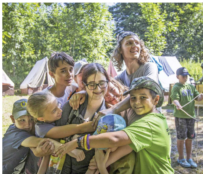
Na letním táboře.