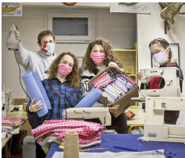
Skauti šijí ochranné roušky.