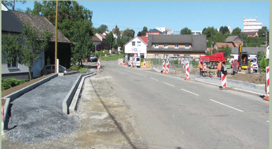
Práce na návsi.

Ano, tato dotační akce probíhá. Začínají se budovat oplocenky v zatravněných údolnicích, na podzim se budou vysazovat stromy a keře. (vc)