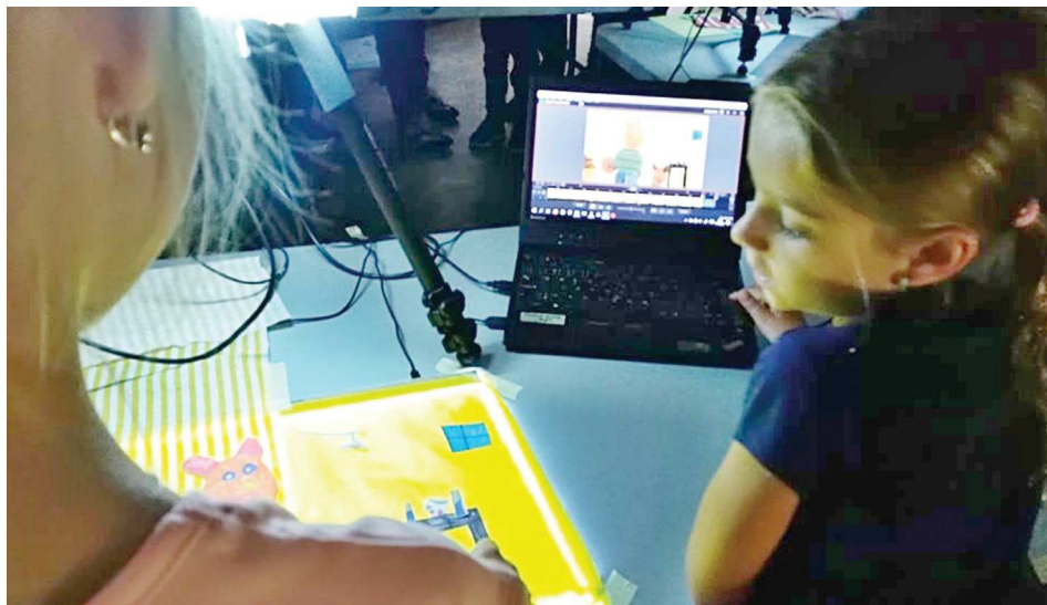
Žáci z Tečovic navštívili Zlín Film Festival.