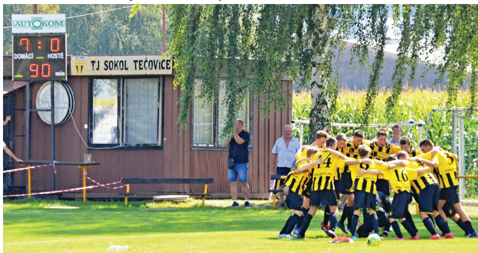
Oslava po zápase.