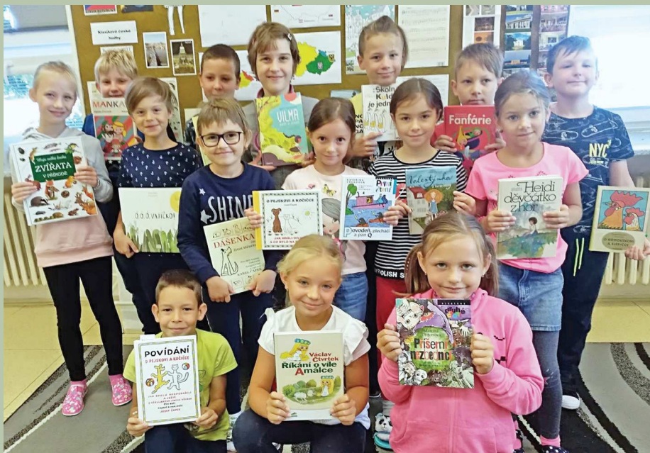
Začátek školního roku ve třetí třídě.