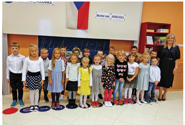
Prvňáčci začínají v ZŠ Tečovice svůj první školní rok.