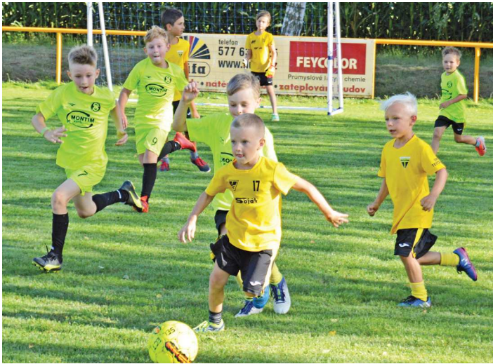
Přípravka mladší: Útočná akce domácích v zápase s Mysločovicemi