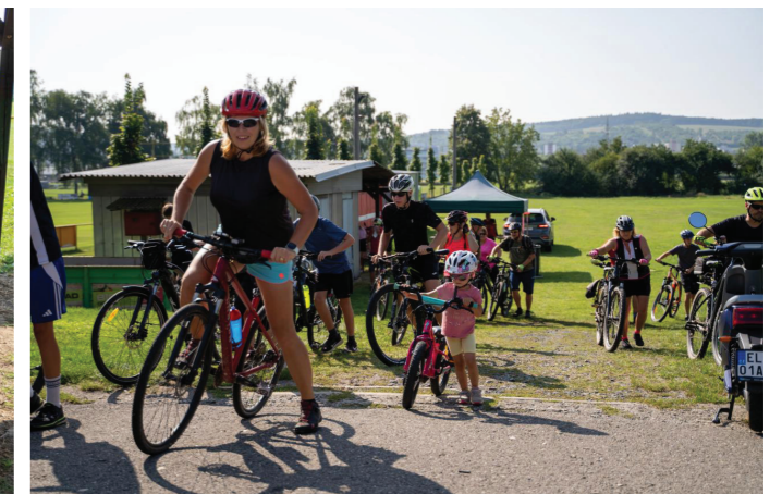
Na 600 cyklistů se sešlo při 2. ročníku akce Tour de Židelná. Trasa spojuje všech devět obcí tohoto mikroregionu. Na šest set účastníků projelo všechna kontrolní stanoviště, která se nacházela v jednotlivých obcích. Tam na ně čekalo bohaté občerstvení. Závěr výletu byl letos naplánován v Rackové.