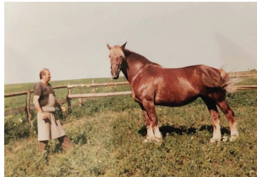
BÁRKA - Českomoravský belgický kůň