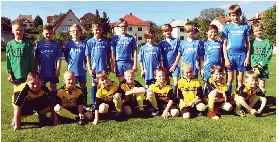
TJ Sokol Tečovice – léto 2019 – příprava – okresní soutěž Zlínka