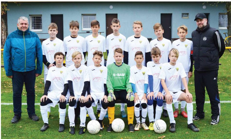
TJ Sokol Tečovice – podzim 2019 – starší žáci - okresní přebor Zlín, sk. A