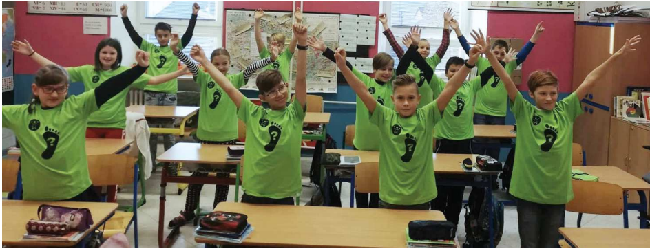
V páté třídě.