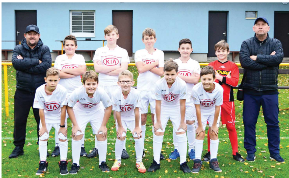
TJ Sokol Tečovice – podzim 2019 – mladší žáci - okresní přebor Zlín, sk. A