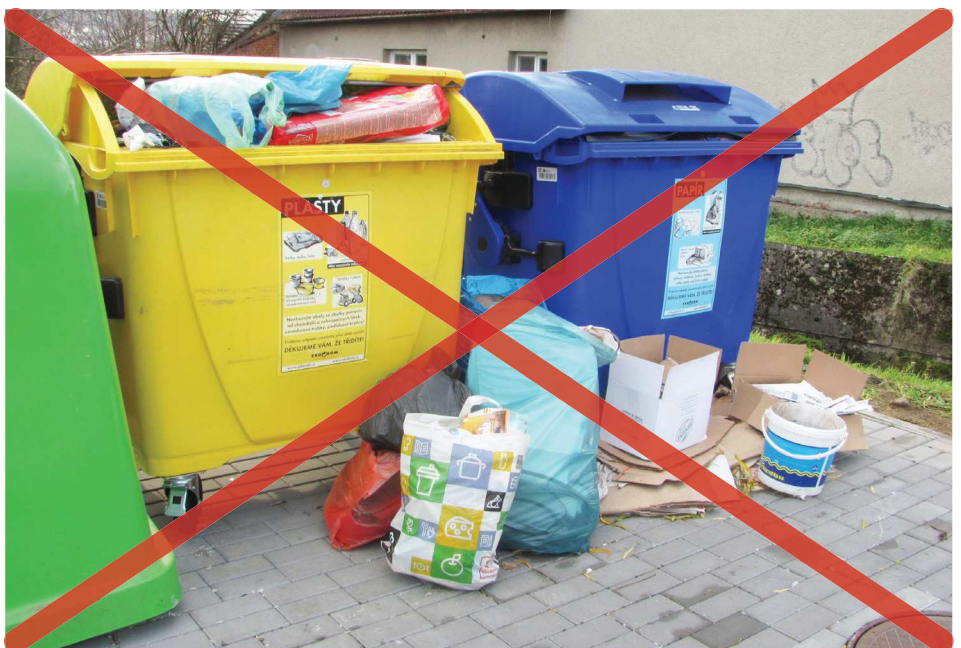
Takhle ne! Mimo kontejnery žádný odpad nepatří.

V rekonstruovaném domě v přízemí vznikl také prostor pro umístění obecní knihovny, zatím bez regálů a bez jakéhokoli vnitřního vybavení. Starosta předpokládá, že zde začne knihovna fungovat někdy na jaře roku 2020. (vc)