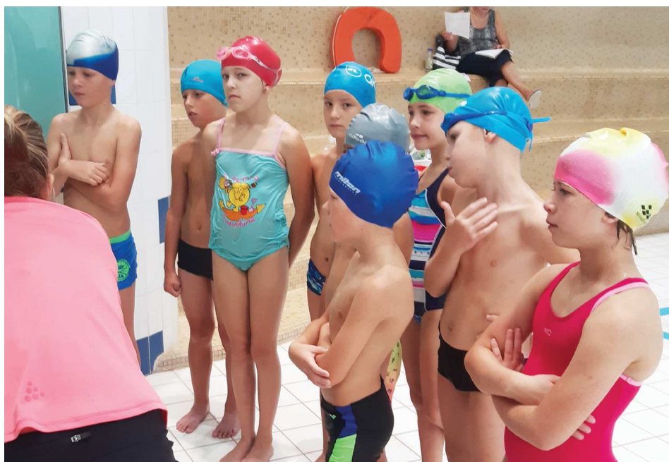
Třetáci se učí plavat.

První a druhé družstvo se 2. října zapojilo do soutěže plavání měst. Všichni žáci byli velmi šikovni.