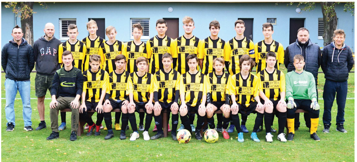
TJ Sokol Tečovice – podzim 2019 – dorost – sdružený okresní přebor KM+ZL