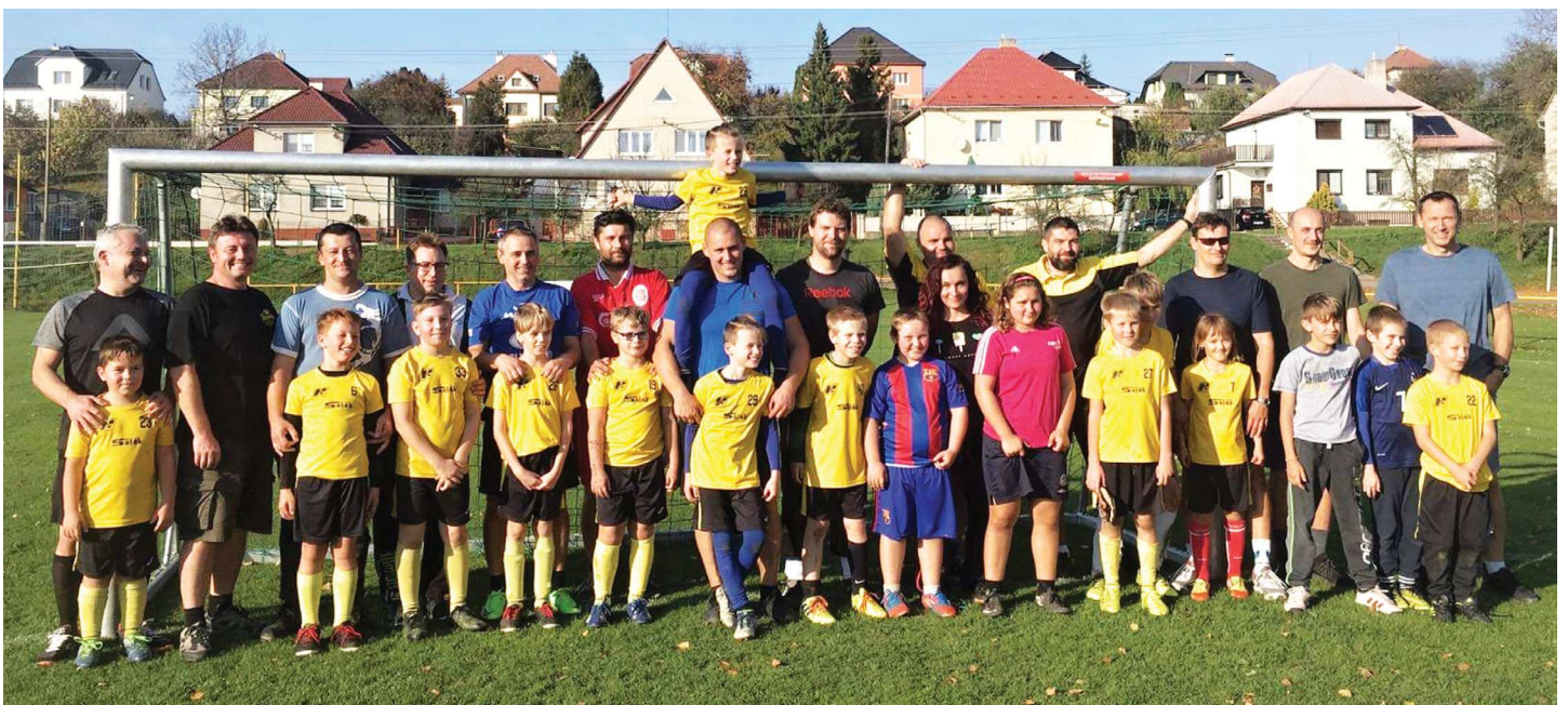
Zakončená – podzim 2019 – reprezentace starší přípravy po zápase s tatínky.