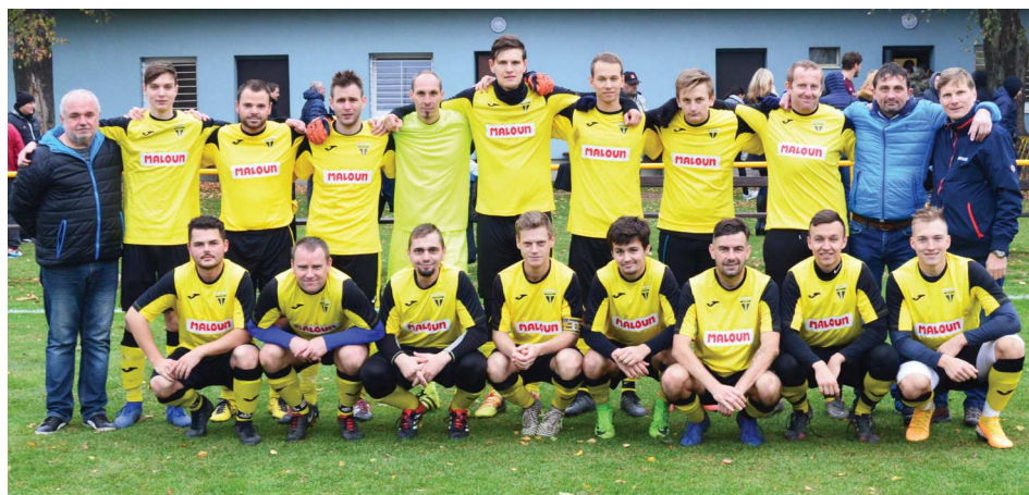
TJ Sokol Tečovice – podzim 2019 – muži „a“ – I.b třída, sk. B

Podzimní sezonu zakončily týmy mužské reprezentace tradiční „zakončenou“ v „Hospodě Ondík“ v areálu TJ Sokol v Králi.