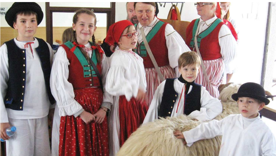
Návštěva akterů hodového vodění berana bylo oživením výstavy.