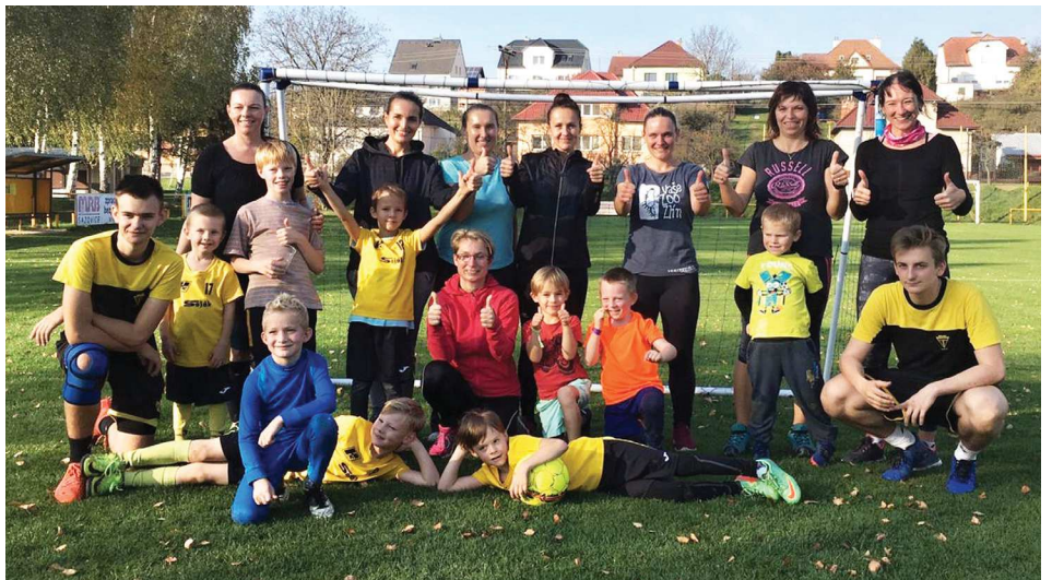
Zakončená – podzim 2019 – reprezentace mladší přípravy po zápase s maminkami.