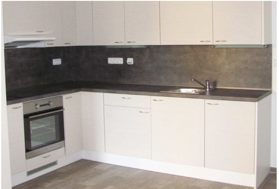
Nové byty v obecním domě čp. 145 jsou připraveny k nastěhování nájemníků.

Velké dílo v hodnotě kolem 19 milionů korun se podařilo dokončit v podobě rekonstrukce obecního domu čp. 145. Ještě do konce tohoto roku by se měli začít stěhovat nájemníci do jeho sedmi sociálních nájemních bytů. Dům již úspěšně prošel kolaudací.