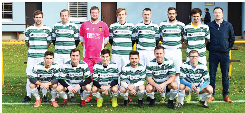
TJ Sokol Tečovice – podzim 2019 – muži „b“ – III. třída, sk. a – Zlín