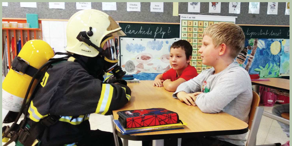
Hasiči v základní škole.