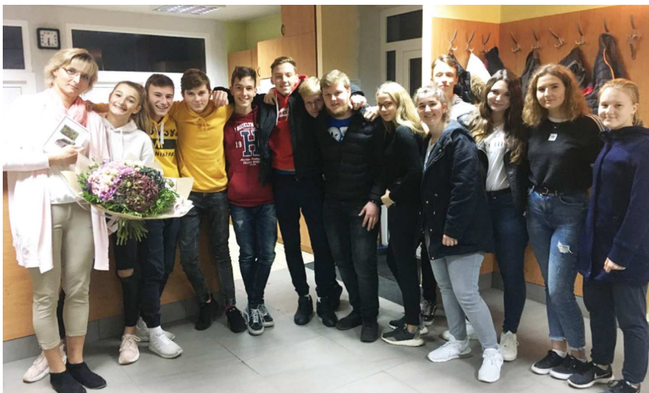
Ukončená dorostu za hasičskou zbrojnicí.

Příchod topné sezony a nastávající adventní čas nám přináší také spoustu rizik vzniku