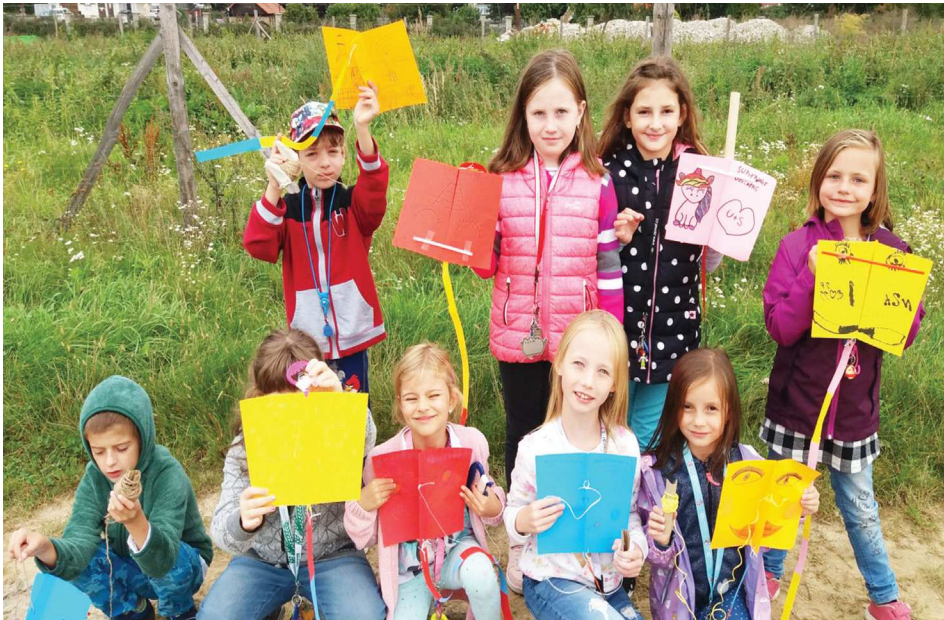
Ve školní družině se děti nenudí.