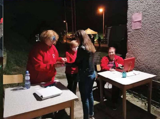
září / Focus rock