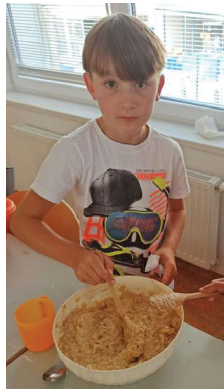
Jabličkové lívance ve školní družině.