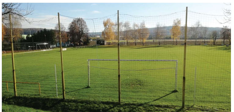
Opuštěný areál V Králi po přerušení soutěží během letošního podzimu.