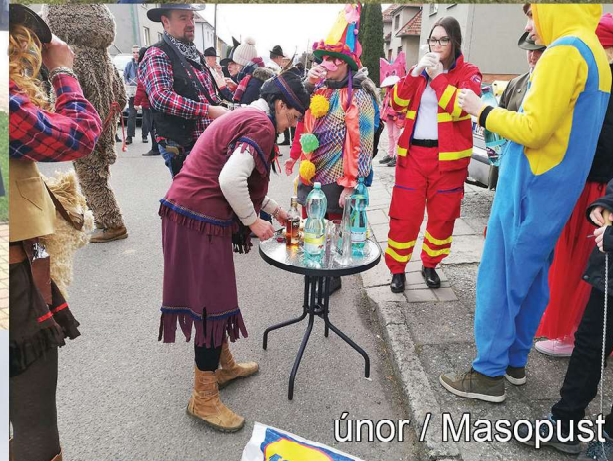
únor / Masopust