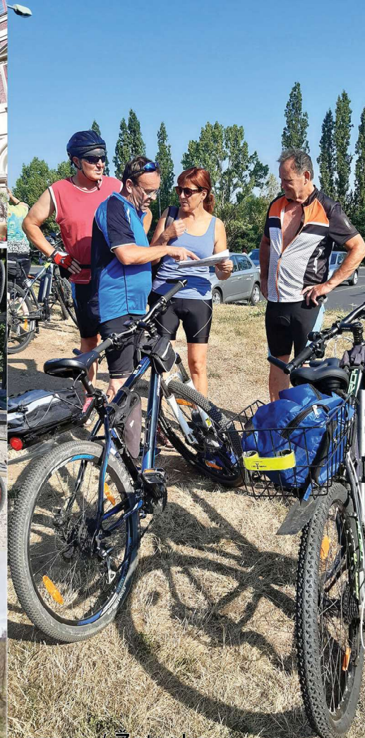
srpen / Žatecko