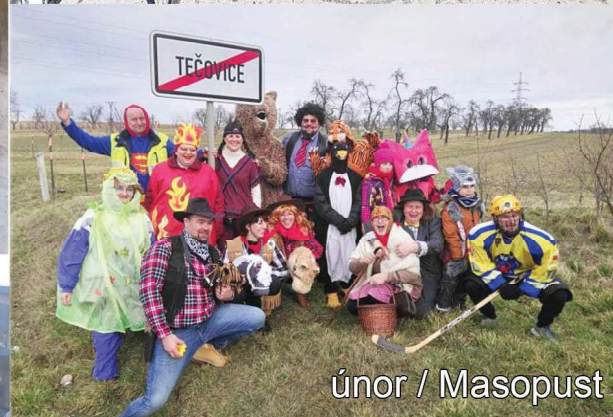
únor / Masopust