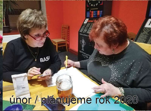
únor / plánujeme rok 2020