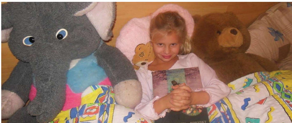
Noc s Andersenem.