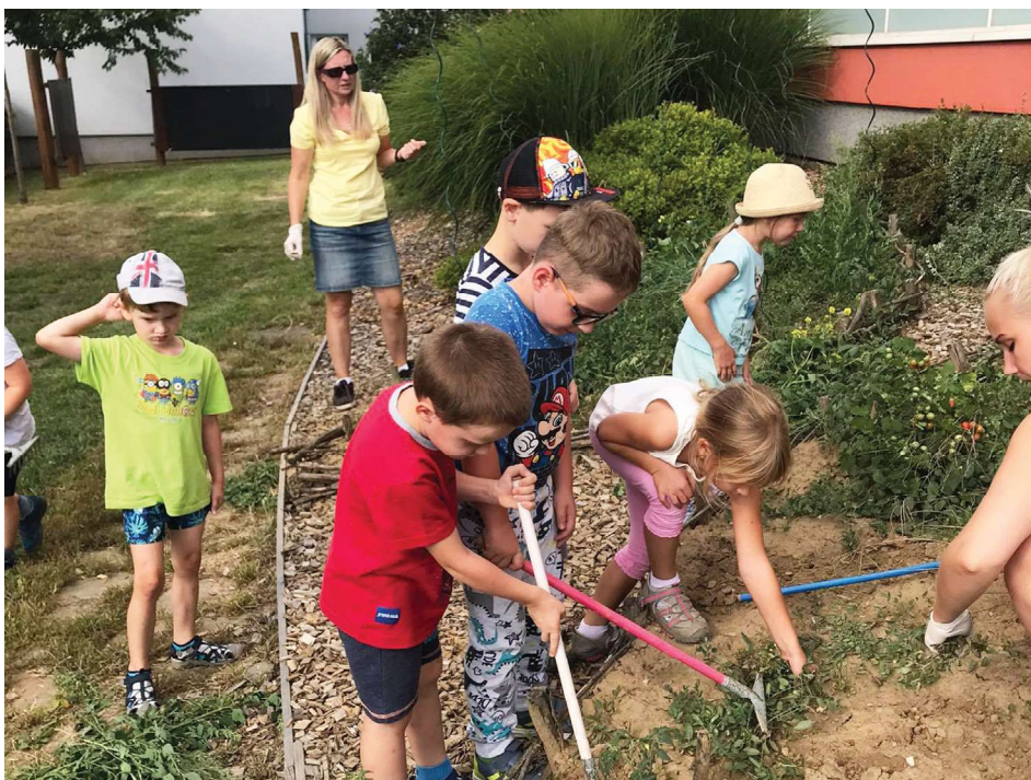
Úklid zahrady mateřské školy.

Vzhledem ke zlepšující se situaci doufáme, že nás už v nejbližší době čeká spousta dalších akcí a aktivit, které nejen cíleně doplňují, obohacují a zpestřují vzdělávací proces, ale také nám společný čas strávený v mateřské škole dělají příjemným a radostným. (aj)