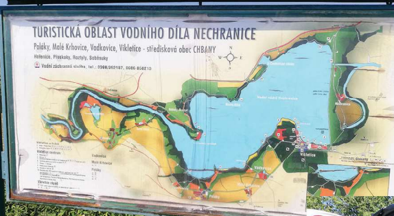
srpen / Žatecko