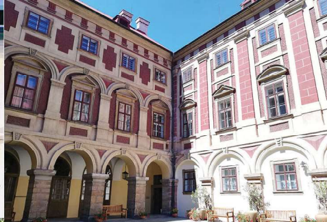
srpen / Žatecko